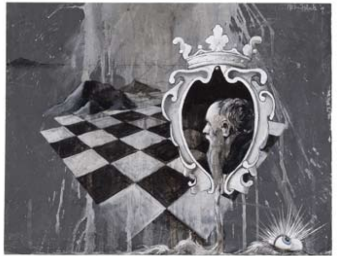
Wandering over the hills unseen, 2009 Rainmakers, 2009