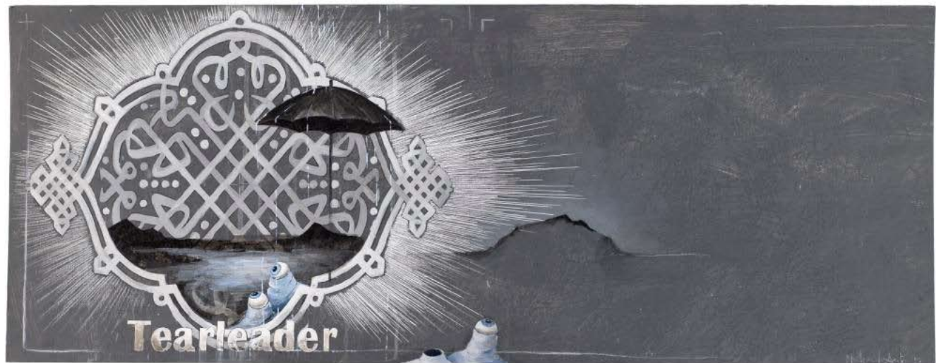
Mushroomhill, 2009 Mont Geriatria, 2009 Tearleader, 2009