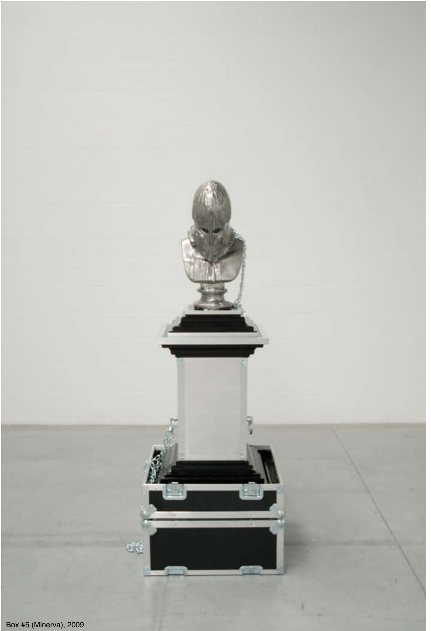
Box #5 (Minerva), 2009