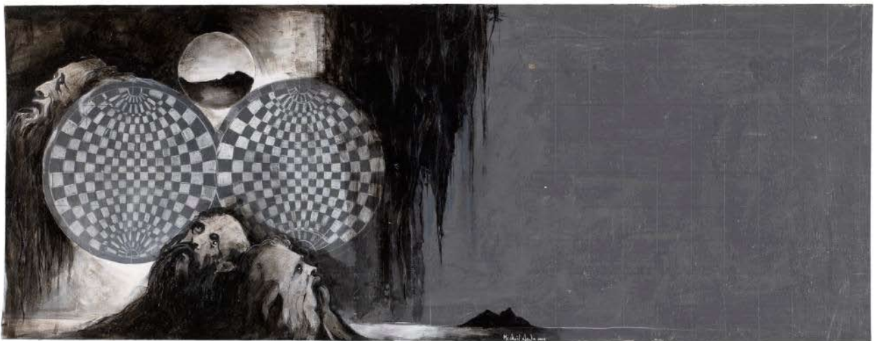
Map for the Wanderer Ridge Ecstasy, 2009 It's a kind of shadow, reaching into the night, 2009