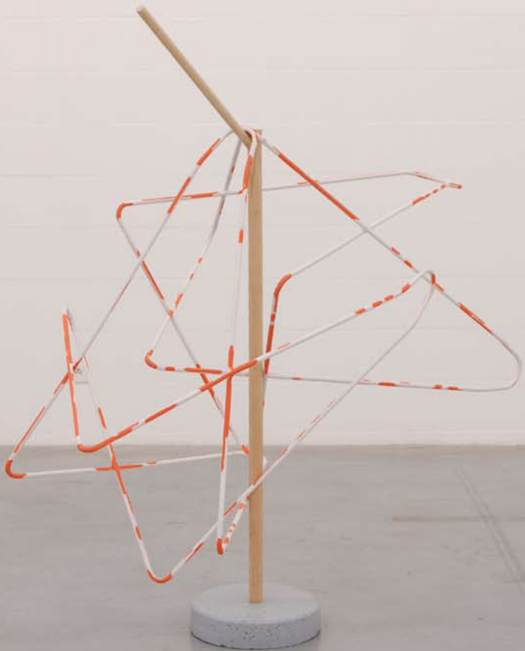
Kissing butterflies, 2009