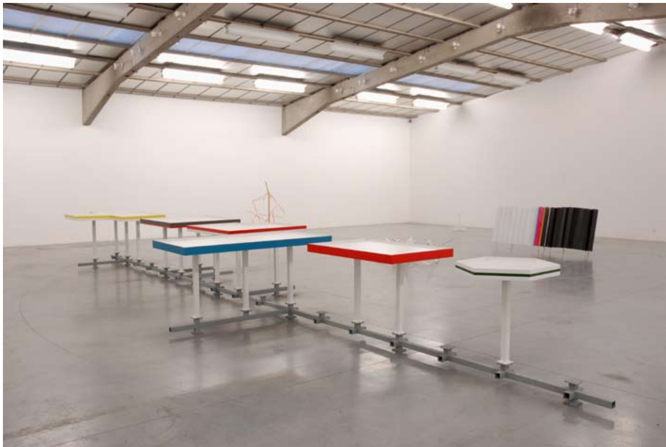
The happy end of a univocal metal taste, 2009