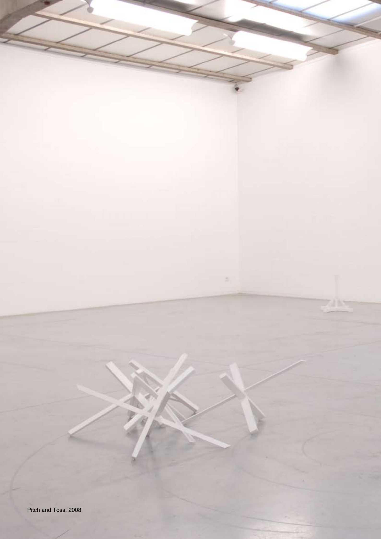
Pitch and Toss, 2008