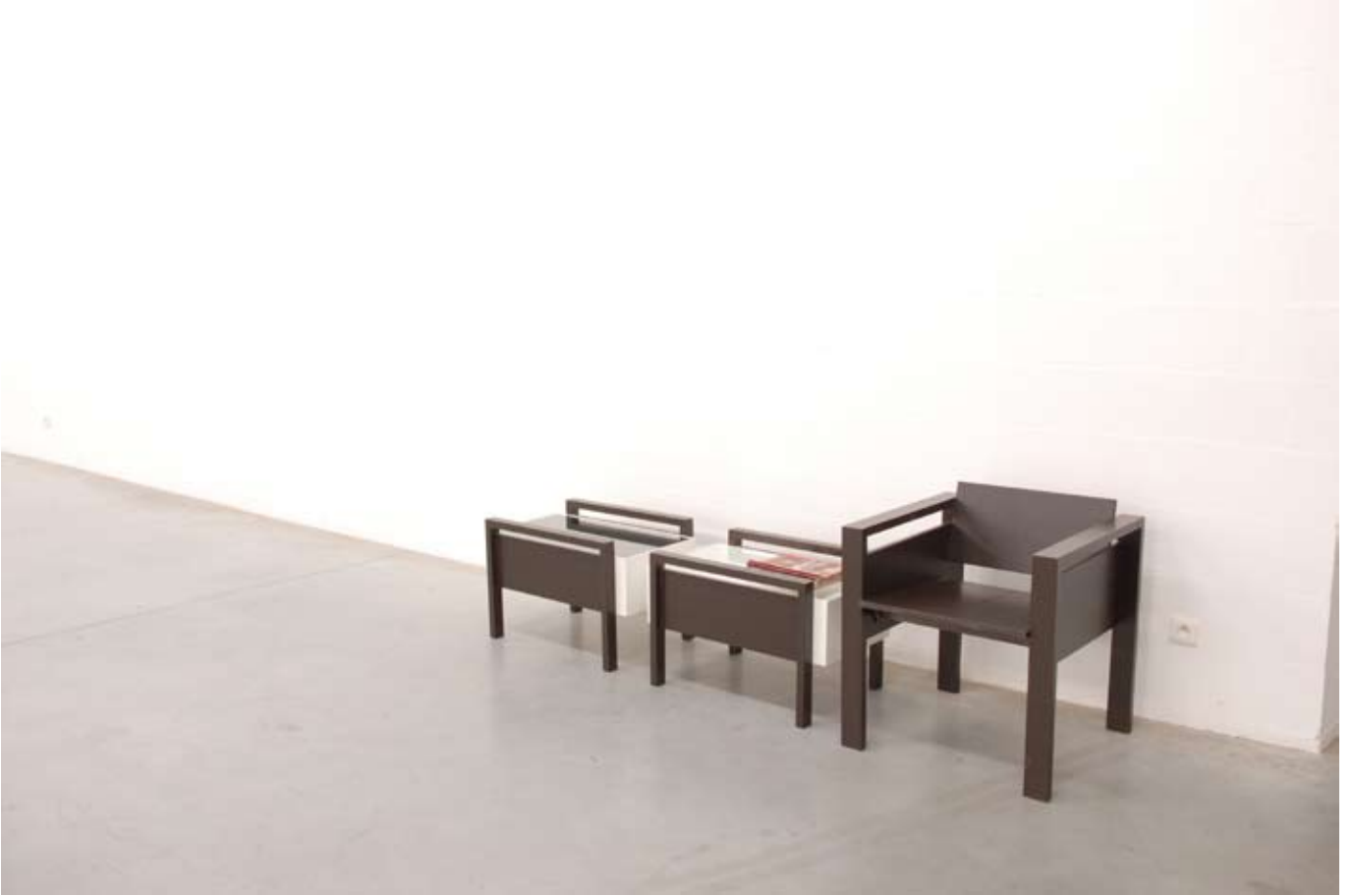
Breaking News, 2008