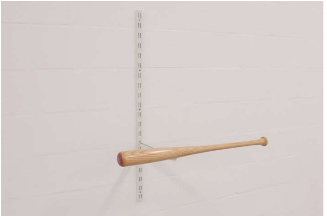
New Balance, 2008