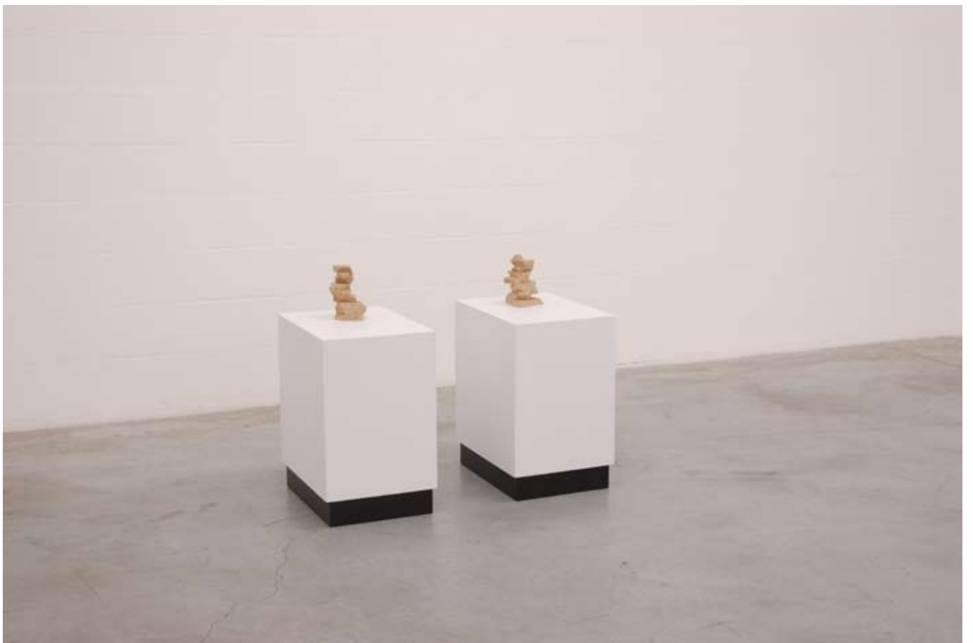
Sculpture I (Ghost Shift series), 2008 / Sculpture II (Ghost Shift series), 2008